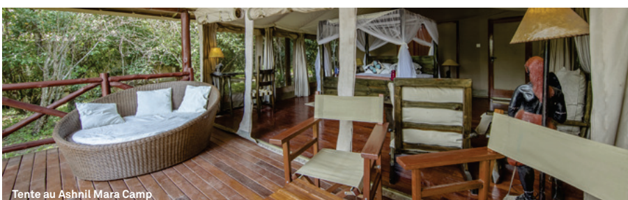
Tente au Ashnil Mara Camp

RABAIS PAIEMENT COMPTANT : - 100 $ SUPPLÉMENT CHAMBRE SIMPLE : SUR DEMANDE BASE PRIVÉE : AUCUNE RÉDUCTION APPLICABLE